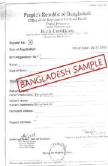
<孟加拉国出生证明书>