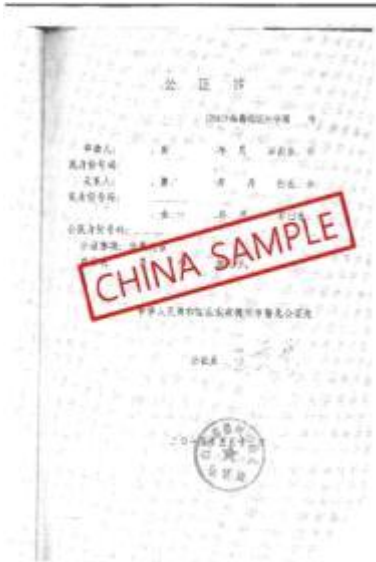
<中国亲属关系证明公证书>

出生证明和家族关系证明 (如果原件不是英文则需要附加翻译件) Birth certificate