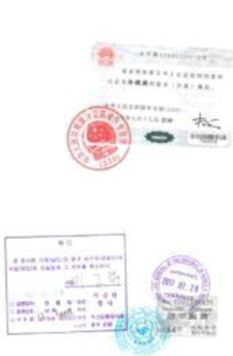
<中国学位证公证件大使馆认证>

大使馆学位证明认证书 Verification of diploma from Korean Embaasy