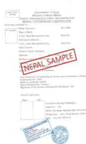
<尼泊尔家族关系证明书公证件>

大使馆学位证明认证书 Verification of diploma from Korean Embaasy