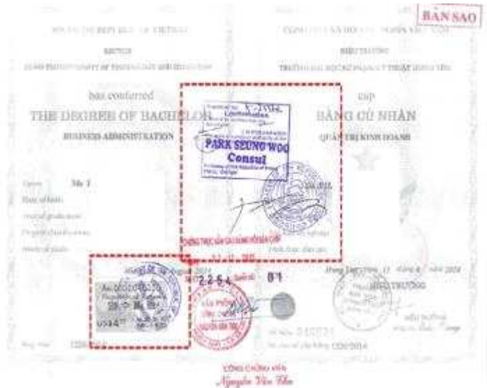
<越南学位证书大使馆认证>